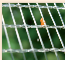
Oeufs de chrysope auxiliaire

secondaires et d'observer l'activité des auxiliaires.