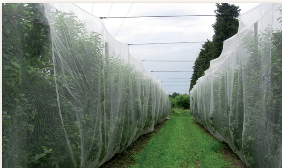
Alt'Carpo mono-rang avec écarteurs de type élastique