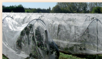
Ecarteurs en tuyau de polyéthylène

Les écarteurs : sur jeune verger où la frondaison est encore peu développée, un système écartant le filet des arbres est nécessaire (écarteurs sur la ligne ou tendeurs élastiques entre ligne).