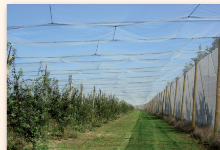
Tournière intégrée sous le filet

Sur les 2 autres côtés perpendiculaires aux rangs, on peut couvrir la tournière : dans ce cas, une ou plusieurs portes devront être mises en place. On peut aussi opter pour un système de type rideau qui ferme la parcelle au niveau des extrémités des rangs. Différents systèmes d'ouverture sont proposés par les fournisseurs.