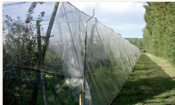
Alt'Carpo mono-parcelle Le filet s'arrête au niveau du palissage (système rideau).