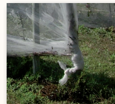
Bout de rang

Fermeture en bout de rang : afin de parfaire l'étanchéité, faire un genre de tresse et fermer avec des aiguilles ou des plaquettes.