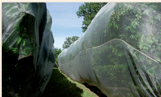
Alt'Carpo mono-rang sur cerisier

On a également observé une efficacité secondaire très intéressante d'Alt'Carpo sur les populations de psylle. Ce n'est pas un effet direct du filet mais la conséquence de l'augmentation de la faune auxiliaire favorisée par la diminution des traitements insecticides.