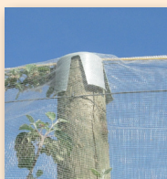
Chapeau de piquet

Dans le cas contraire, le filet repose directement sur les arbres mais les temps de manipulation annuels peuvent être un peu plus importants. Des chapeaux sont fixés sur les piquets pour éviter les perforations à ce niveau.