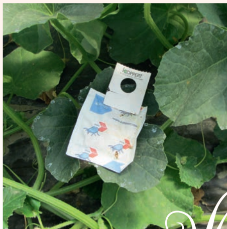
Sachet papier contenant l'auxiliaire Neoseiulus californicus