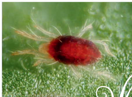
Acarion tétranyque ( Tetranychus urticae )

Appelés couramment "araignées rouges", les acarions tétranyques sont des ravageurs redoutables en maraîchage. Les conditions climatiques en Provence, chaudes et sèches, sont idéales à leur développement.