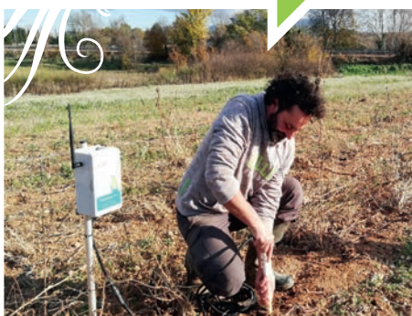
Installation d'une sonde capacitive avec son boîtier d'envoi.

Le suivi des données d'humidité avec l'interface est simple et même attractif car la sonde réagit rapidement.