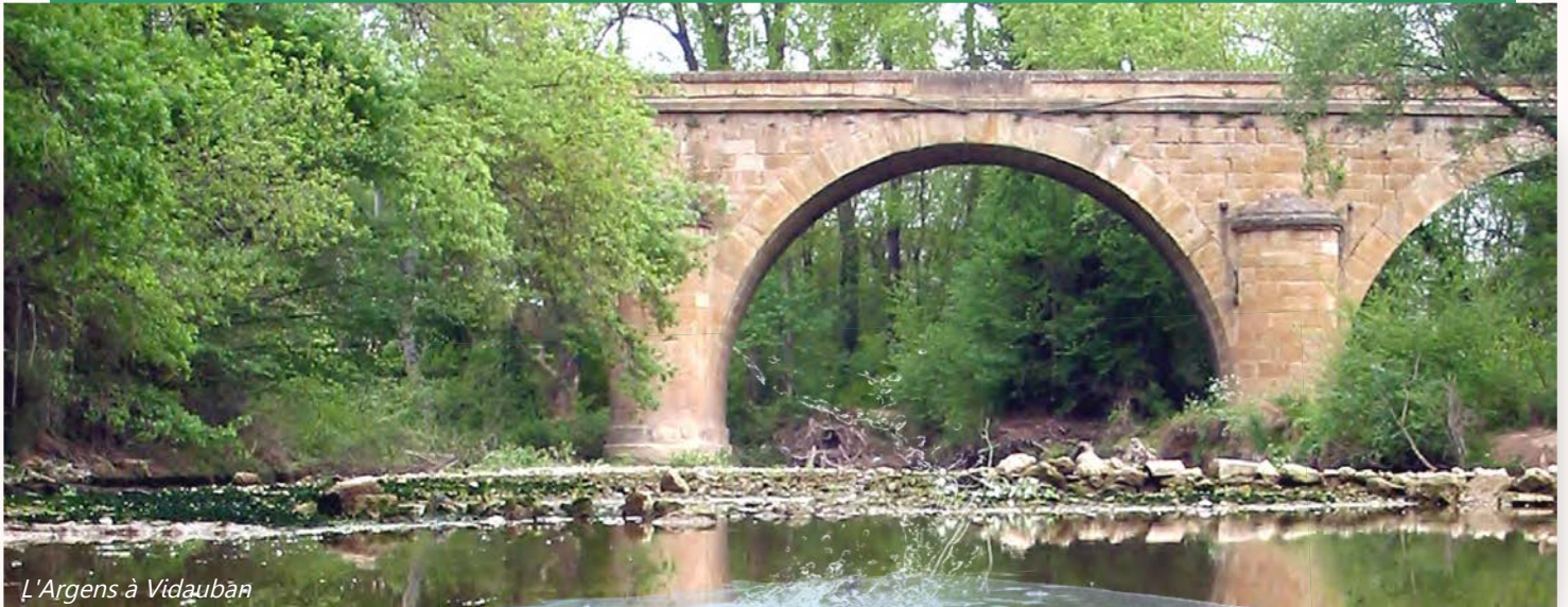
L'Argens à Vidauban