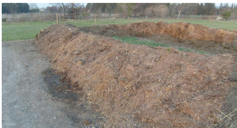
Plateforme de lombricompostage Chaubs EURL à Velleron (84)