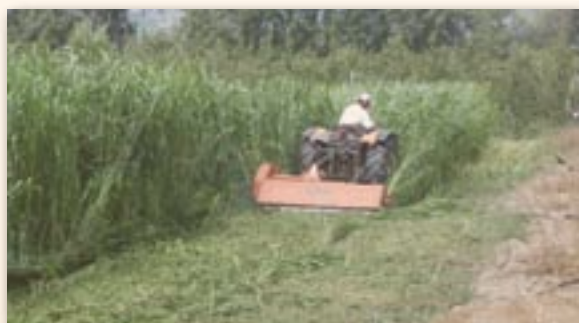
1 ère coupe en juillet

Un réseau de 7 parcelles à replanter en pommier a été suivi en 2007 sur la région PACA. Sur les parcelles où le sorgho (variété Piper) s'était bien développé, les mesures de croissance ont montré une augmentation de la longueur des pousses annuelles en fin de 1ère feuille de l'ordre de 90%. Durant la phase de développement des 3 premières feuilles, la circonférence du tronc a progressé de près de 25% par rapport au témoin sans sorgho.