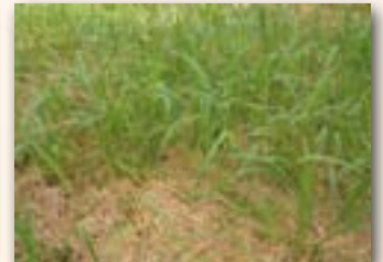
Repousse du sorgho après une première coupe