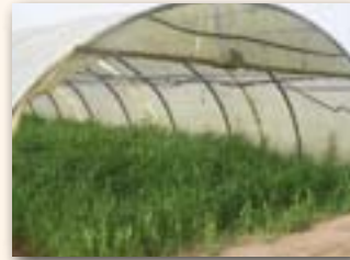
Sorgho sous tunnel

Le sorgho est une espèce rustique qui se contente des réserves du sol en éléments fertilisants. Des sols trop riches en azote peuvent provoquer le phénomène de verse. Sur des sols trop pauvres, un apport d'engrais azoté en cours de culture peut éviter un manque de croissance et des chloroses.