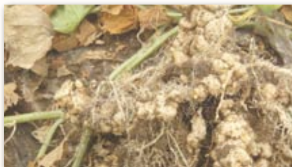
Nématodes sur racines de melon

Les nématodes sont capables d'effectuer leur cycle de développement sur la plupart des variétés de sorgho testées mais moins facilement que sur les espèces marâchères. Ces dernières années, l'intérêt du sorgho fourrager pour l'assainissement du sol, notamment vis à vis des nématodes, a été étudié par l'APREL, le GRAB, le Ctifl et l'INRA PACA Sophia-Antipolis. Deux modes d'action possibles ont été mis en évidence :