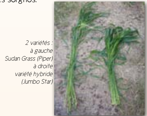
2 variétés : à gauche Sudan Grass (Piper) à droite variété hybride (Jumbo Star)