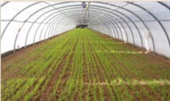
Semis sous tunnel

Les semences sont enfouies à 2-3 cm de profondeur puis le sol est légèrement tassé. Un 1 er arrosage doit être fait rapidement après semis pour favoriser une bonne germination et éviter le déplacement des graines par les fourmis.