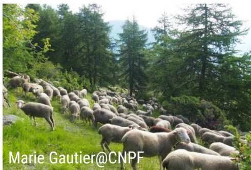
Troupeau dans le mélèzin

Nous pourrons nous regrouper dans les voitures les plus adaptées aux pistes forestières.