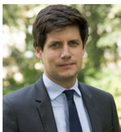
Julien Denormandie, ministre de l'Agriculture et de l'Alimentation

La crise de la Covid-19 a rappelé l'importance stratégique de notre agriculture. La mobilisation sans faille de l'ensemble de la chaîne agricole a permis de garantir à tous les Français, dans l'Hexagone et dans les Outre-mer, un accès à l'alimentation. Grâce aux efforts des femmes et des hommes de la ferme France, produire notre alimentation sur notre territoire est un atout pour assurer notre souveraineté alimentaire. Si la chaîne a tenu durant la crise, celle-ci a aussi révélé nos vulnérabilités à même de fragiliser notre indépendance alimentaire. Le paradoxe est connu : la France est la première puissance agricole en Europe mais nous dépendons encore de trop d'importations, par exemple en protéines. La priorité du plan de relance, et les moyens déployés sont à la hauteur, est la reconquête de cette indépendance .