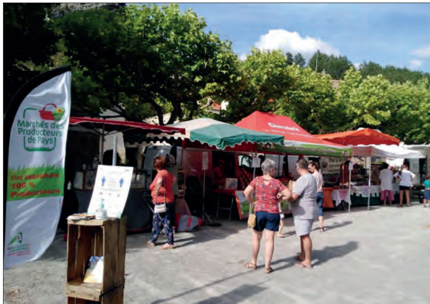
Dans les prochaines semaines, de nombreux marchés regroupant uniquement des producteurs locaux vont se tenir dans les deux départements alpins.

Et, enfin à Moustiers-Sainte-Marie le 6 août, avec de grands jeux en