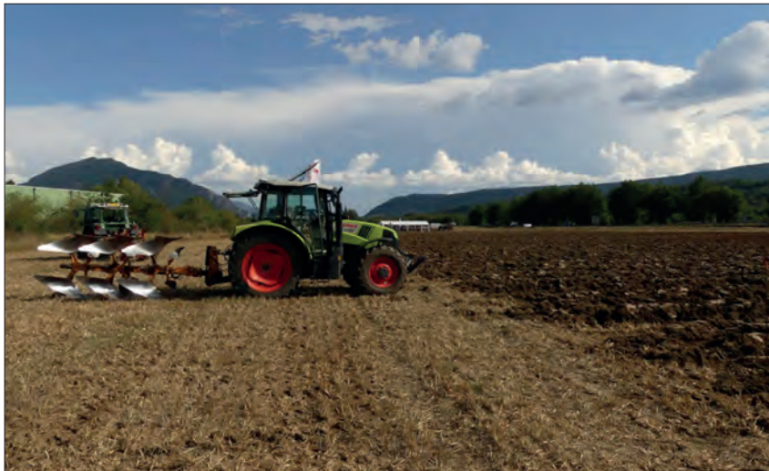
Depuis de nombreuses années, la saison estivale est le théâtre de l'affrontement des as du sillon dans les Hautes-Alpes et les Alpes-de-Haute-Provence à l'occasion des concours de labour. Cette année, ils se dérouleront à Chabottes et à Mane.

Ce sont les jeunes agriculteurs haut-alpins qui ouvrent le bal des concours de labour avec les finales départementales les 12 et 13 août à Chabottes, dans le Champsaur-Valgaudemar.