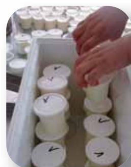
Étuvage en glacière

Bien utilisée, elle permet de conserver suffisamment de chaleur pour permettre à la fermentation de se dérouler correctement et obtenir ainsi le niveau d'acidité escompté.