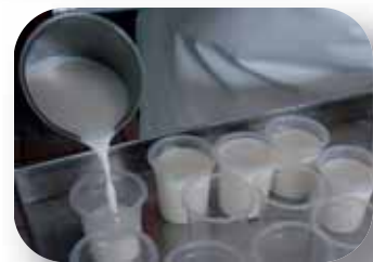
Mise en pots manuelle