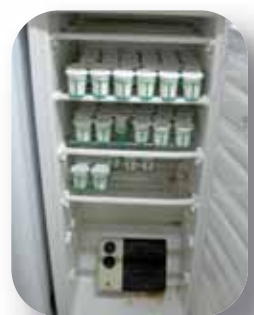
Congélateur recyclé en étuve à yaourts grâce à l'installation d'un convecteur électrique couplé à un thermostat