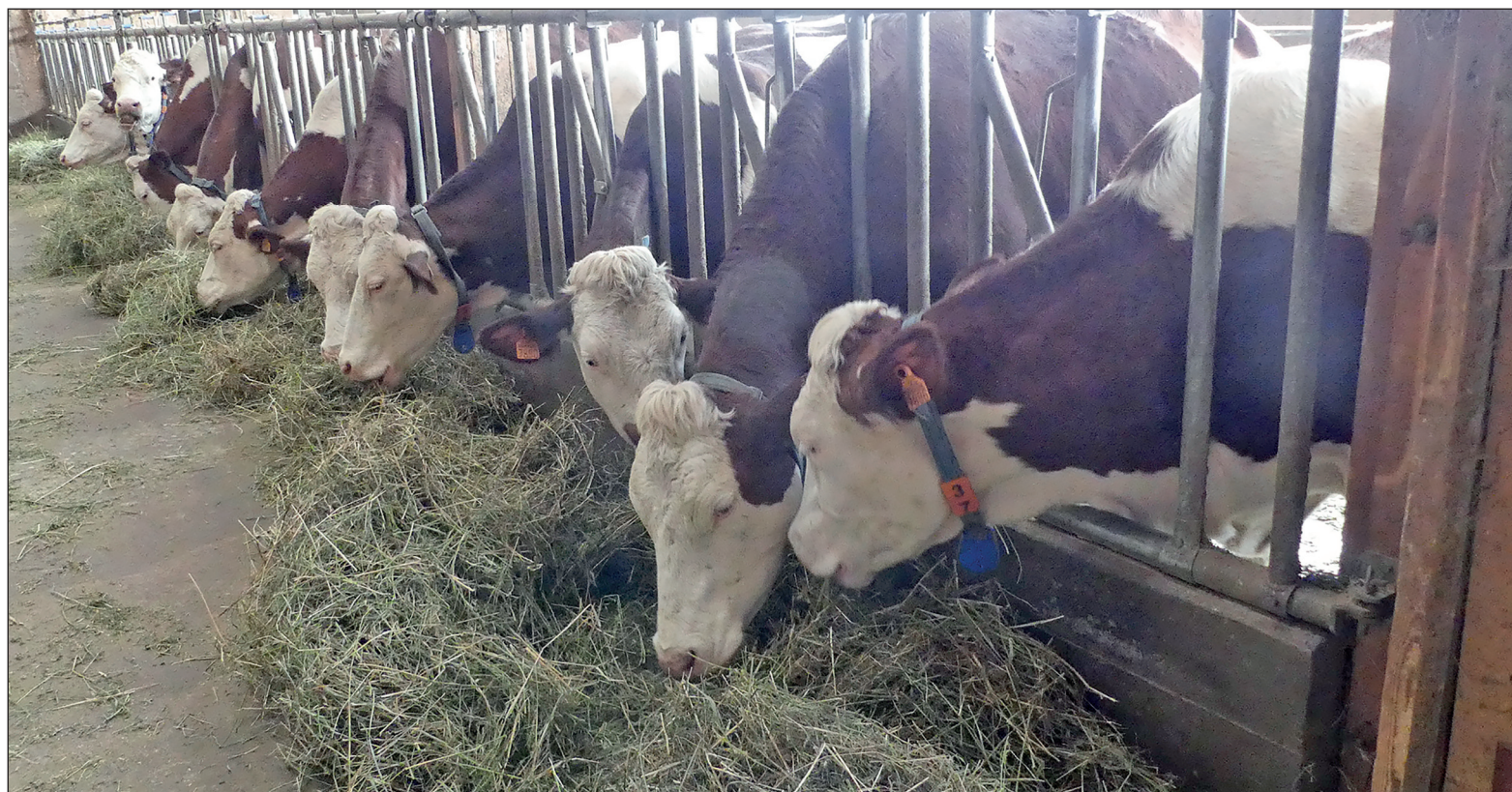
La hausse du poste aliment représente 40 à 50 % de la hausse totale des charges. C'est le poste qui pèse le plus. La chambre d'agriculture des Hautes-Alpes peut accompagner les éleveurs qui veulent améliorer leurs rations.

Le poids des différents postes diffère selon les hypothèses de hausse des charges retenues : la hausse du poste aliment représente ainsi 40 à 50 % de l'augmentation, les engrais 12 à