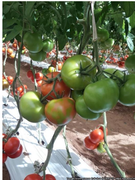
Symptômes sur Solanum lycopersicum