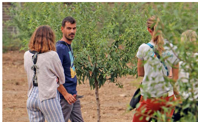
Des démonstrations de taille d'amandiers étaient organisées en marge de la présentation du projet 'Elzéard', au sein des vergers d'expérimentation.