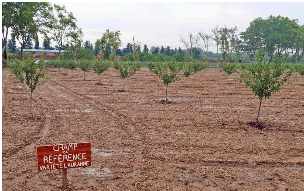
Deux vergers expérimentaux d'amandiers ont été plantés au printemps, sur 1,8 hectare, à Saint-Rémy-de-Provence.

Si la culture de l'amandier se développe en région Paca, sa production en bio reste en revanche limitée. La faute à un manque de réponses adaptées contre les ravageurs et les maladies. Le projet 'Elzéard' ambitionne de lever ce frein, avec la mise au point de solutions techniques pour viabiliser cette culture en bio.