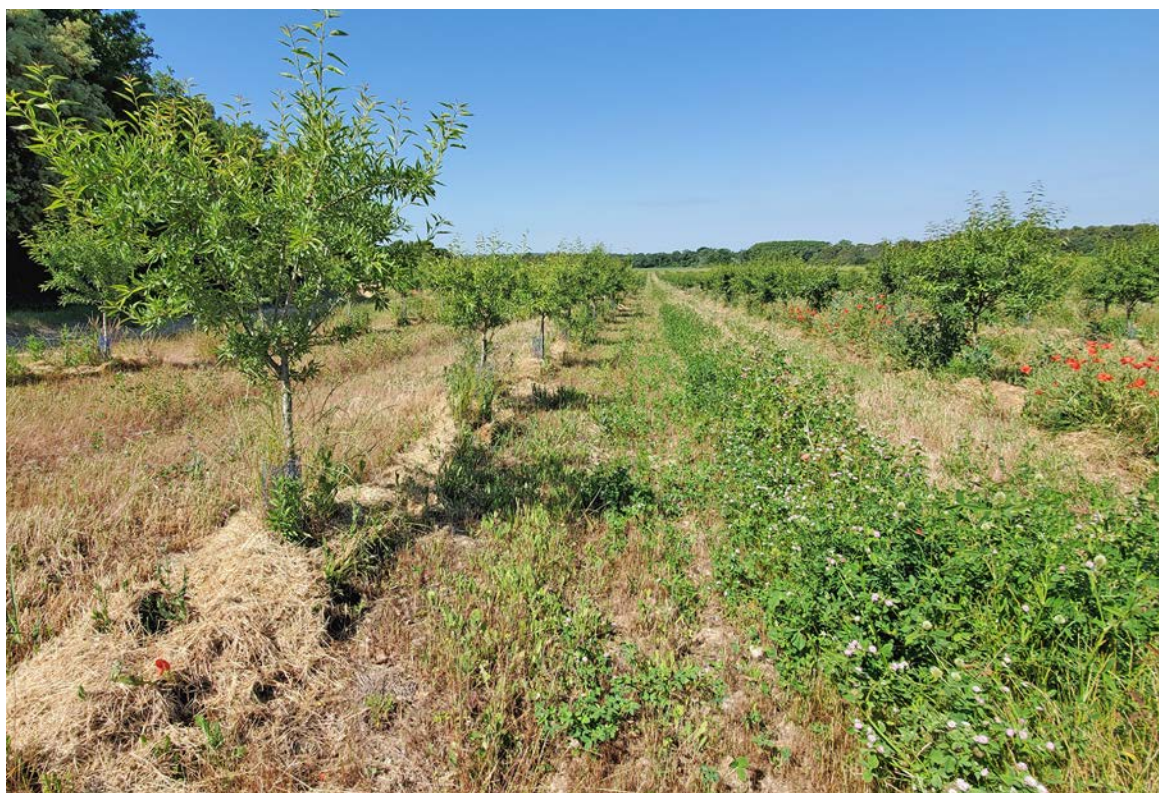
Sur Rognes, tout a été pensé pour créer les conditions les plus favorables à l'implantation d'un verger au cœur de l'un des territoires historiques de l'amande provençale.