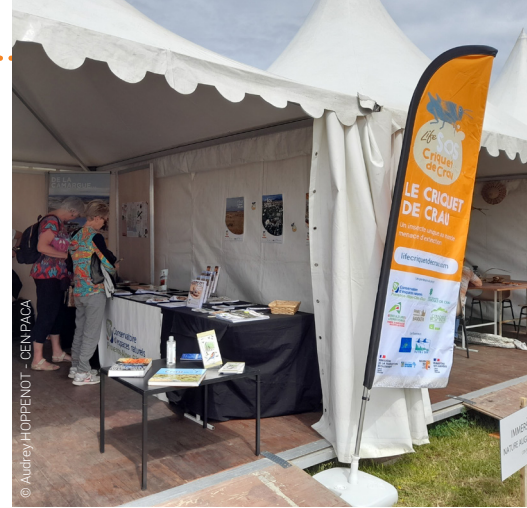
Festival de la Camargue et du delta du Rhône, mai 2022