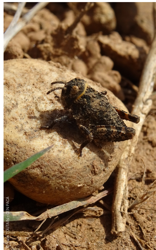
Criquet de Crau juvénile