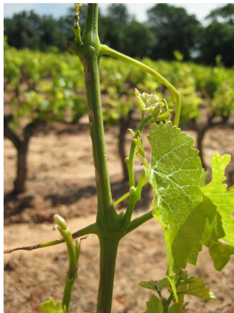
Départ d'entre-cœurs à l'extrémité du rameau

Dans ce cas, vous perdrez une année pour la formation de vos cordons mais vous repartirez sur des bois sains l'hiver prochain.