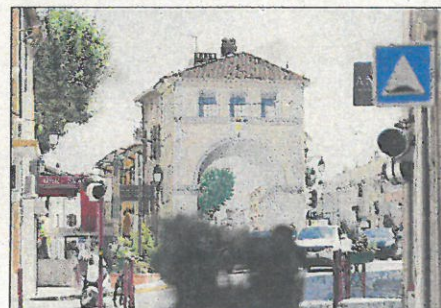
Les commerçants de la ville offrent nombre de services en drive ou en livraison. (Photo doc. D. L.)

Producteur (livraisons) : Chez Jo Primeur - 06 66 27 51 82. Bee Api - 06 61 44 32 32. Moulin du Partegal - https://moulinpartegal.fr/6-boutique-en-ligne . Moulin à huile Guiol-