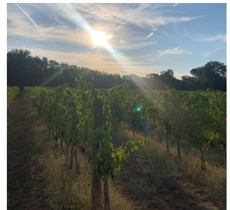
Rangs de Mourvèdre au Cannet des Maures (C. Pouget)

*le cépage testé doit posséder une valeur (V) agronomique (A), technologique (T) et environnementale (E) suffisante par rapport aux cépages témoins (connus de la région)