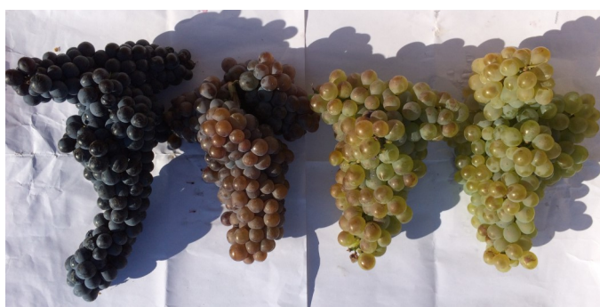
De gauche à droite : Mourvèdre noir témoin, Mourvèdre gris, Mourvèdre Blanc et Clairette blanche témoin (G. Marcantoni)

De plus, ils ont des débourrements tardifs : les risques d'impact des gels de printemps sont donc limités. Soulignons que ces cépages à peau épaisse sont peu impactés par la grêle sur grappes. Ils sont également plus résilients face à la sécheresse que la Clairette blanche: impact limité du stress hydrique alors que la Clairette a un arrêt précoce de croissance à mi-juillet, des défoliations importantes et de l'échaudage sur baies à l'approche des vendanges.