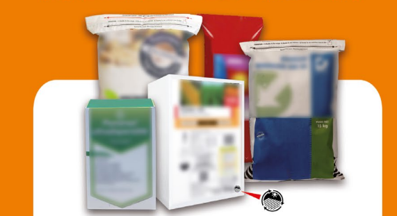
Produits phytopharmaceutiques et fertilisants