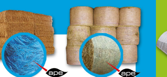
Conditionnement des fourrages, palissage vigne et horticulture