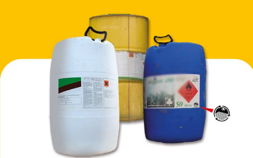
Produits phytopharmaceutiques et fertilisants