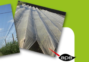
Protection des cultures arboricoles