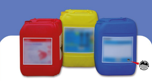
Produits d'hygiène de l'élevage laitier