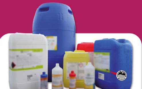
Produits œnologiques et d'hygiène de cave