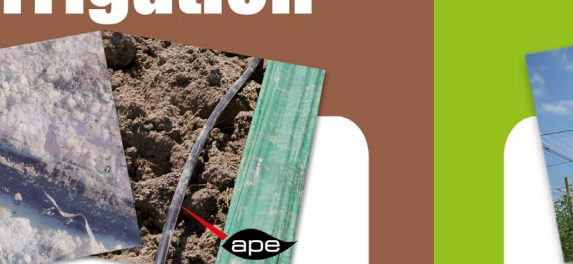
Gaines plastiques jetables