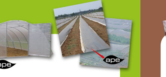
Couvertures de serres Paillage, hors-sols, solarisation, petits tunnels