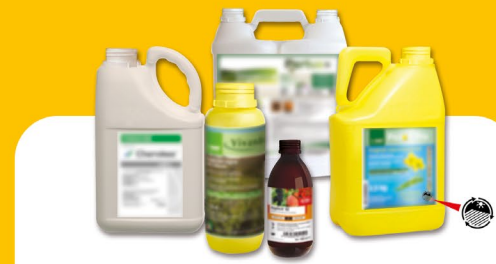
Produits phytopharmaceutiques et fertilisants