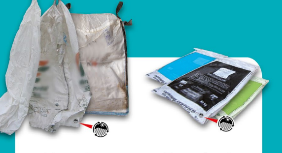
Engrais, amendements, et semences