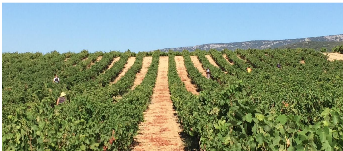
Prospection dans le sud Luberon en 2017

Dans ce cadre, les ODG du Ventoux et du Luberon ont sollicité la Chambre d'Agriculture de Vaucluse pour assurer l'encadrement des prospections d'une partie des périmètres de lutte Obligatoire. Une équipe « Encadrant » composée de 14 ingénieurs et techniciens de la Chambre d'Agriculture de Vaucluse assurera la coordination et l'animation de ces prospections.